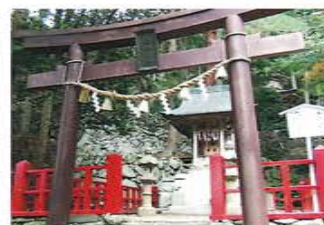
金椿(かなくい)神社

本来、お金についた不浄を洗い流す場所ですが龍の口から流れ出る清らかな水で宝くじなどを洗う参拝者も近年、見られるようになりました。すぐそばには弁財天をお奉りした弁財天奉安殿もあります。