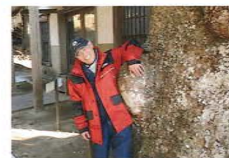
タブノキ(こぶの木)

大国主命、菅原道真公他10柱をお祀りした金椿神社。商売、学業は実力だけではなく、ご縁、運も大事です。疾病、災害の多い日本、金(カネ)の杭(クイ)を打って被害を止めるという云われがあります。