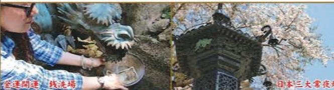
※運航時間、料金等は2019年10月現在のものです。

※金華山パワースポットめぐりへの参加は事前予約が必要です。前日17:00まで電話にてご予約をお願いします。